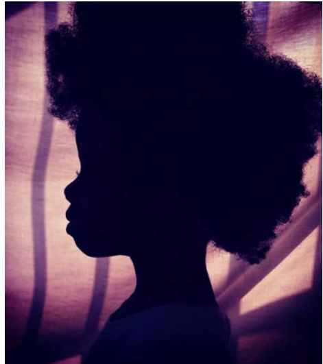
© Nana Kofi Acquah, „Afro auf Lilja“.

Mehr Informationen finden Sie auf www.worldpressphoto-ol.de und