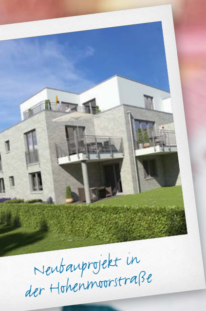
Neubauprojekt in der Hohenmoorstraße